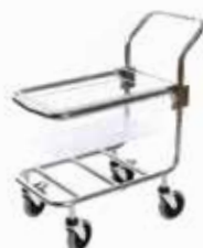
Гастрономическая тележка с поддоном